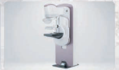
Передовая маммографическая система - Senographe Pristina