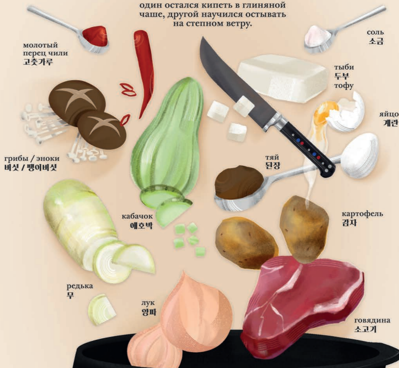
молотый перец чили 고춧가루

один остался кипеть в глиняной чаше, другой научился остывать на степном ветру.