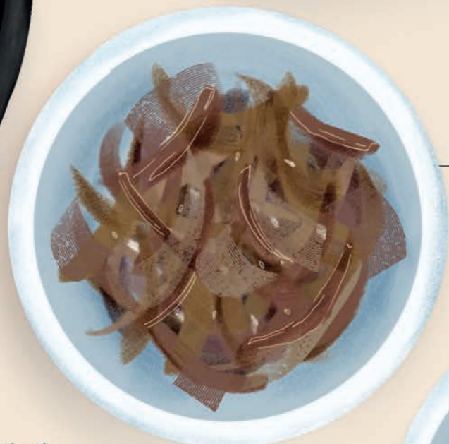
косари-ча 고사리나물 папоротник