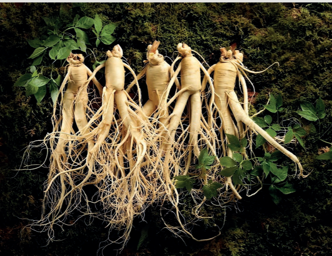
Женьшень – символ жизненной силы и энергии. Растение содержит гинзенозиды – группу растительных элементов, которые при употреблении помогают адаптироваться к стрессу, сохранять концентрацию, повышают устойчивость к усталости.

Точного определения термина «суперфуд» нет. Говоря простыми словами, это продукты с высокой питательной ценностью, богатые витаминами и полезными элементами. Среди самых известных: гранат, содержащий множество антиоксидантов, рыба – источник Омега-3, витамина D, селена и некоторых витаминов группы В, авокадо, способный снизить риски сердечно-сосудистых заболеваний, и др.