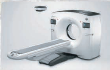
Единственный в Казахстане: КТ 256 срезов