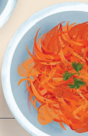
морков-ча 고려인들이 단근으로 담근 김치 морковь