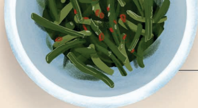
ёмди-ча 부추무침 джусай