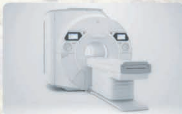
Впервые в Центральной Азии: MPT 3.0 Tesla

Диагностические системы Premium класса из Южной Кореи, Америки и Японии