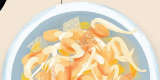
нокты-ча 콩나물무침 проросшие бобы